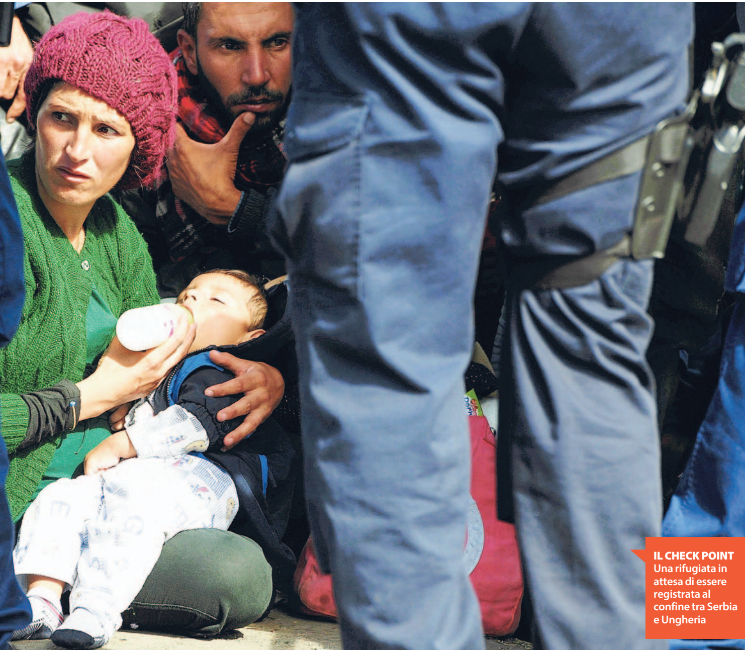
IL CHECK POINT Una rifugiata in attesa di essere registrata al confine tra Serbia e Ungheria